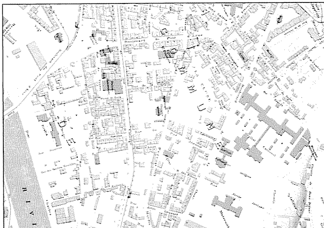
Plan de Genève, de sa banlieue et de Carouge, dressé par J. R. Meyer. Mise à jour 1915 Extrait reproduit à l'échelle 1:10000 (doc. AEG)