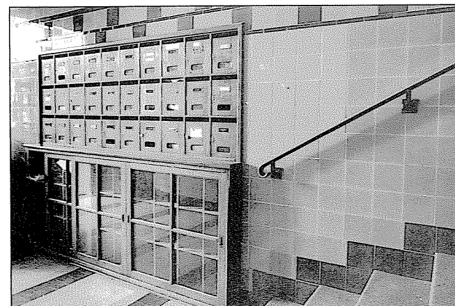
Rue Cingria 5