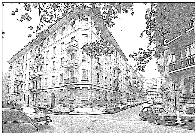
Rue du Pré-Jérôme 9 à 15, rue Cingria