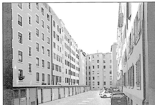
Rue Cingria, rue Prévoist-Martin; l'intérieur de l'îlot