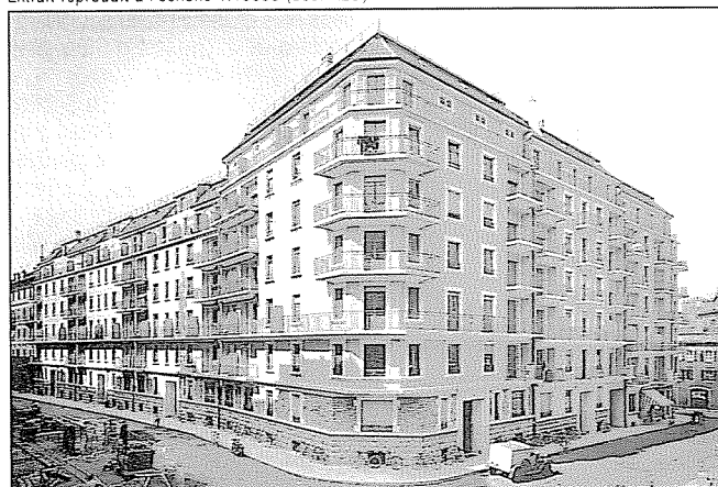
Rue Cingria côté pair, rue Jean-Violette, avril 1932