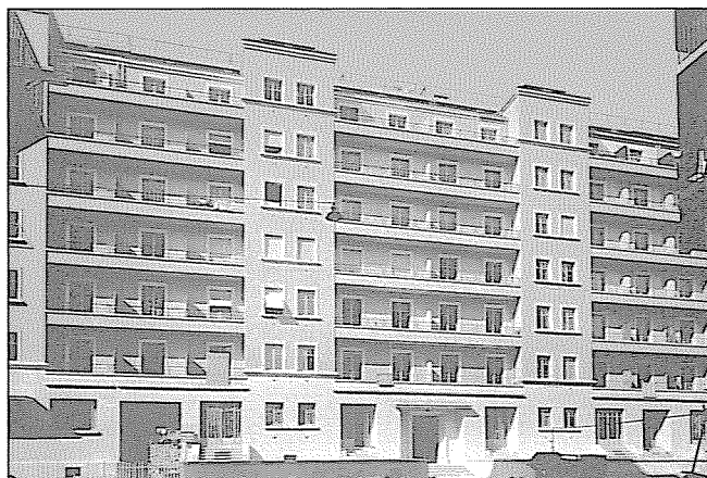
Rue Jean-Violette 23 à 27, juillet 1932