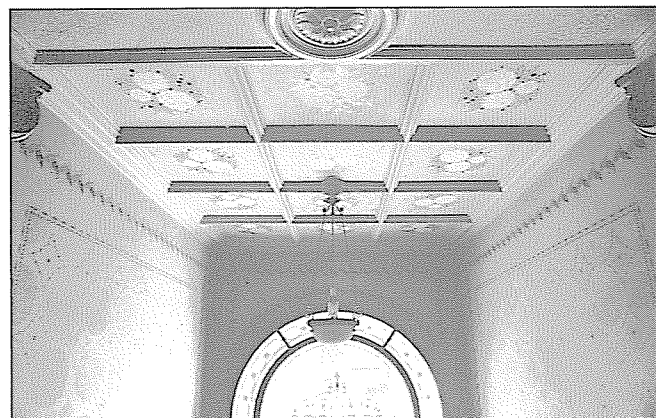
Rue John-Rehfous 3