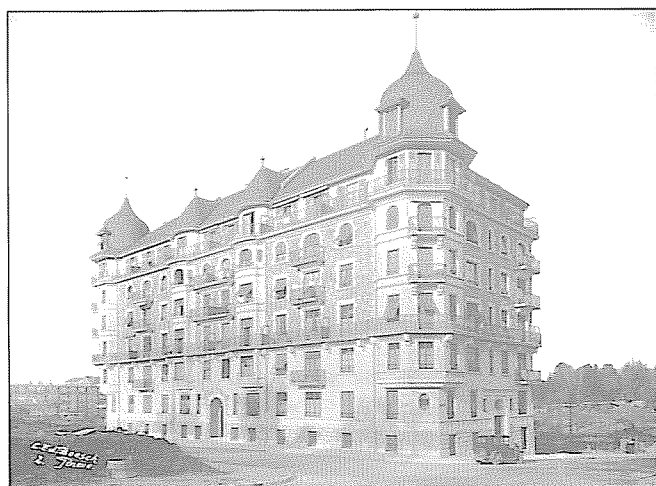
Angle rue John-Rehfous, rue Gustave-Muller-Brun, 1924-1928