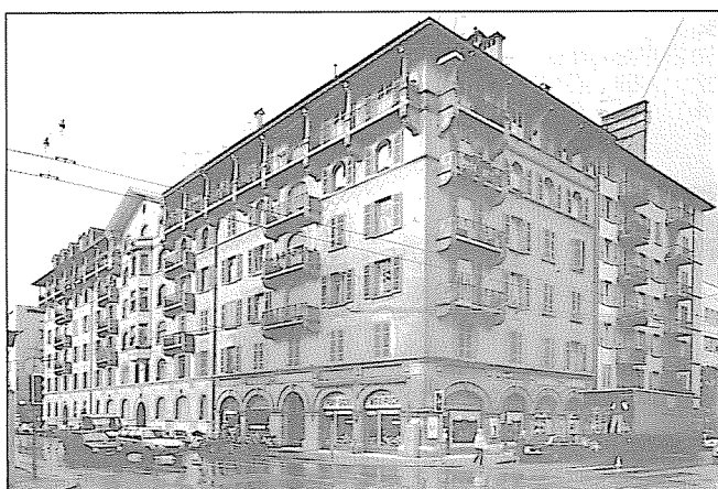
Angle rue de l'Ecole-de-Médecine, boulevard Carl-Vogt