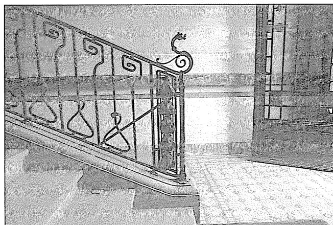
Rue de l'Ecole-de-Médecine 16