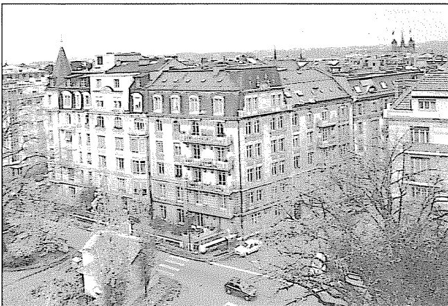
Rue De-Beaumont 11, rue Michel-Chauvet 12