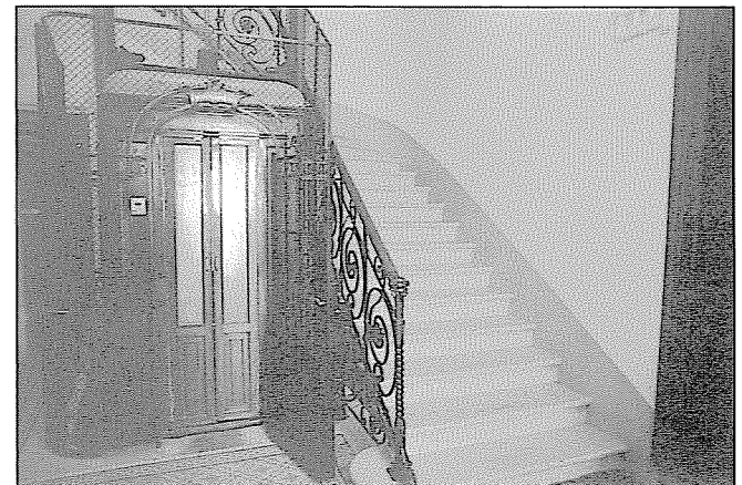
Rue de Saint-Jean 92