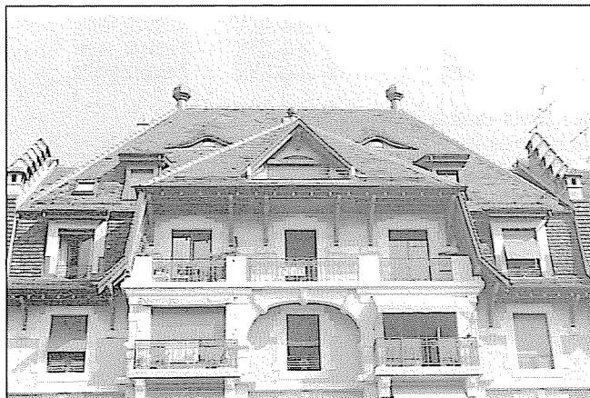
Rue de Saint-Jean 88