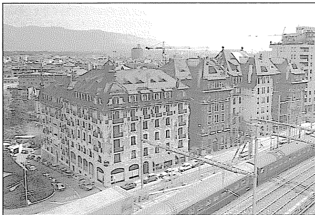
Rue de Saint-Jean, du côté des voies ferrées